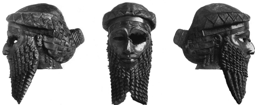
Slika 4. Maska kralja Sargona ili njegovog unuka Naram-sina. Čuva se u Nacionalnom muzeju Iraka, u Bagdadu. 8

Elamitska invazija uništila je Ur u vreme Ibi-Sina (2015. p.n.e.), poslednjeg kralja Treće dinastije. Velika stela Ur-Namua, spomenik izgradnji zigurata u Uru, tom prilikom je polomljena na komade (stela je danas rekonstruisana i nalazi se u Muzeju arheologije i antropologije u Pensilvaniji). Drugi sumerski gradovi, Uruk, Larsa i Ur, nakon vekova nezavisnosti pod lokalnim vladarima, konačno su ujedinjeni pod elamitskim kraljevima. Međutim, novi osvajači južne Mesopotamije i sami su ubrzo pali pred rastućom moći amoritskog Vavilona (Legrain 1944, 49-50). No, politička nezavisnost Sumerana je nakon elamitskih i amoritskih invazija definitivno izgubljena, a novi centar političke moći u ovom delu sveta postao je upravo Vavilon. Drugim rečima, nakon pada Ura, region je ušao u period haosa, a različiti amoritski vladari su preuzeli kontrolu nad važnim gradovima, kao što je Vavilon, koji je kasnije postao novi centar političke moći u Mesopotamiji.