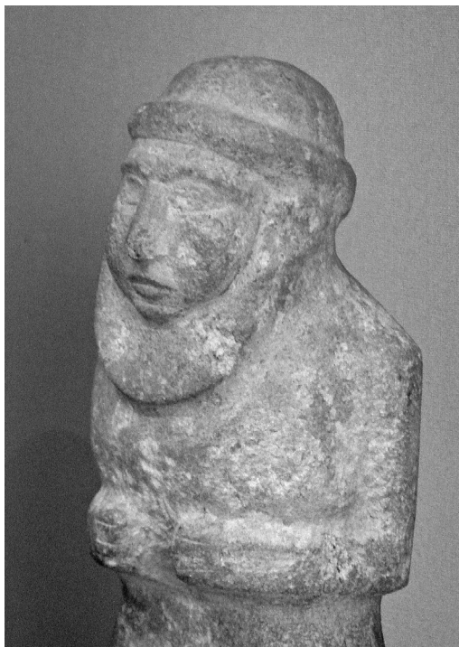
Slika 3. Uručki kralj-sveštenik. Oko 3300. god. p.n.e. Muzej Luvr. 5

Unio mystica sa drugim onostranim entitetom, Nanom, božanstvom Meseca, podrazumeva simbolički spoj između sveštenice i boga (ne kralja, kao u kultu Inane i Dumuzija). U gradu Meseca, Uru, verovalo se da Nana silazi na zemlju u najmračnijoj noći godine. Procesiju od glavnog grada do Karzide, gde je postavljeno njegovo privremeno boravište pre ponovnog ulaska božanstva u grad, predvodili su kralj i sveštenica. Ritual „svetog braka“ u okviru kulta boga meseca nije, dakle, uključivao kralja i verovatno nije nužno podrazumevao stvarni seksualni odnos, već je bio simbolički čin u kojem sveštenica leže na svetu postelju u spavaćoj sobi boga (Westenholz 2013, 257).