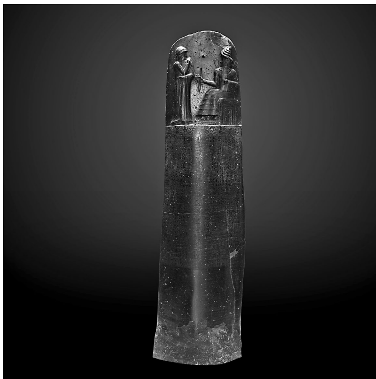
Slika 5. Hamurabijeva stela iz Luvra. Autor: Rama. 13

Tekst na famoznoj steli koja se danas čuva u Luvru može se, prema tome, umesto kao zakonik, definisati kao zbirka sudskih presuda koje je Hamurabi, mudar i iskusan kralj, tokom života doneo sa ciljem da uspostavi čvrstu disciplinu i pravednu vladavinu. Pošto je u Mesopotamiji donošenje presuda bilo kraljevska privilegija, Hamurabi je vrlo verovatno želeo da u svom „Zakoniku“ sakupi izbor glavnih, najmudrijih i najvrednijih pravnih odluka koje će ga predstaviti kao prosvetljenog i iskusnog vladara. Te odluke je dakle donosio on sam, ili ih je diktirao svojim delegatima tokom četrdeset godina vladavine (Ibid., 165).