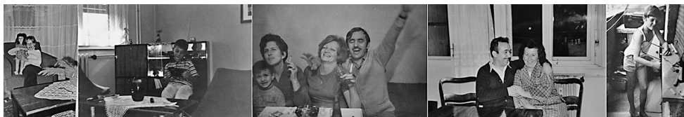
Za kraj, još prizora iz života i dokolice ispitanika