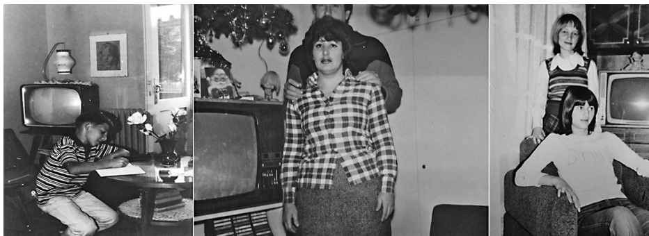
EI Niš televizori prekriveni miljeom i drugim dekorativnim predmetima

predmeta koja je na neki način mogla da ošteti površine nameštaja bila je podmetnuta manjim miljeima raznih oblika i „mustri”. Na početku, televizor ne samo da je zblizavao ukućane, već je mogao da okupi i deo komšiluka koji je u večernjim časovima emitovanja programa dolazio da se zabavi. Tokom sedamdesetih godina većina ljudi mogla je da priušti televizor, te su to na neki način bili prvi znaci raslojavanja među Jugoslovenima. Kasnije se to raslojavanje ogledalo i u posedovanju automobila, čuvenog „fiće” u vremenima kad su dvorišta bila puna dece, a ne parking mesta. Danijela Velimirović, navodeći podatke iz istraživanja Vesne Pešić, kaže da su „kupovina kućnih aparata, automobila, motocikala, modne odeće, vikendice i boravci u inostranstvu menjali (su) kvalitet života”, a potrošnja je postala „sredstvo statusne identifikacije” (Velimirović 2008, 19, nav. prema, Erdei 2012, 69–70).