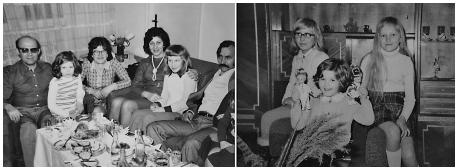
Fotografija levo – sustanari na okupu, Na fotelji članovi porodice koja se nakon četiri godine iselila, sa desne moja ispitička porodica. Fotografija desno – druženje u zajedničkom stanu

Pa ipak, nisam došla do podataka koliko je ovakav način stanovanja bio čest, to jest procentualno zastupljen. Važnost suzbijanja beskućništva, i potreba za iskorenjavanjem privatnog stambenog sektora, u mnogome se oličavala u ovakvom tipu stanovanja. Takva pitanja su kroz različite formulacije bila po-tegnuta u svim sferama javnog života, pa i kroz kulturno – umetničke izraze. Uopšte, cela stambena problematika, otelotvorena je u mnogim delima jugoslovenske kinematografije, a film je možda najpotpunija slika sveta. Ovi problemi su često bili i ekranizovani, te s tim u vezi treba pomenuti film „Zajednički stan” iz 1960. u režiji Marijana Vajde. Poznate su i popularna, a sada već čuvena, serija „Vruć vetar” iz 1980. godine, zatim, trilogija „Rad na određeno vreme”, „Moj tata na određeno vreme”, „Razvod na određeno vreme”, te „Ljubavni život Budimira Trajkovića”.