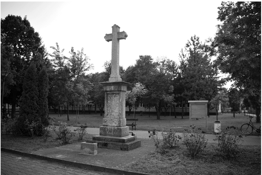
Симоен-крст у центру Меленаца