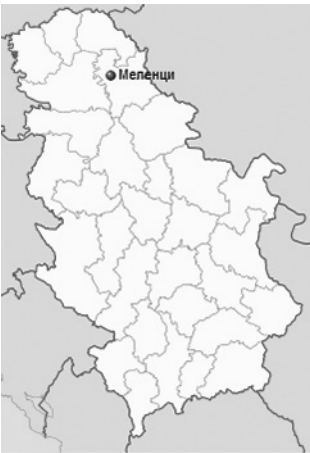
Положај Меленаца на мапи Републике Србије

Према попису становништва из 2011. године, Меленци имају 5.956 становника, што их сврстава у категорију варошица (Митровић 1998; Грошин 2009; 20146). У целокупном српском Банату је само село Мокрин веће од Меленаца, а на подручју средњег Баната, Меленци су највећа селска средина. Највећи број становника је имало 1921. године када је забележено да у њему живи 9.483 људи (Церовић 1984; Грошин 2009; 20146). Од пописа из 1948. године региструје се депопулацијска тенденција – 1948: 8.447, 1951. 8.363, 1961: 8.254, 1971: 8.270, 1981: 7.685, 1991: 7.134, 2002: 6.737 (Грошин 20146). Опадање броја становника је последица ниског природног прираштаја, морталитета, али и расељавања. Старо становништво умире, а млади се чешће опредељују за то да живот наставе у срединама које им омогућују запослење. Насеље је одувек већински српско – са варијацијама нешто испод или нешто изнад 90% (Грошин 2009; 20146).